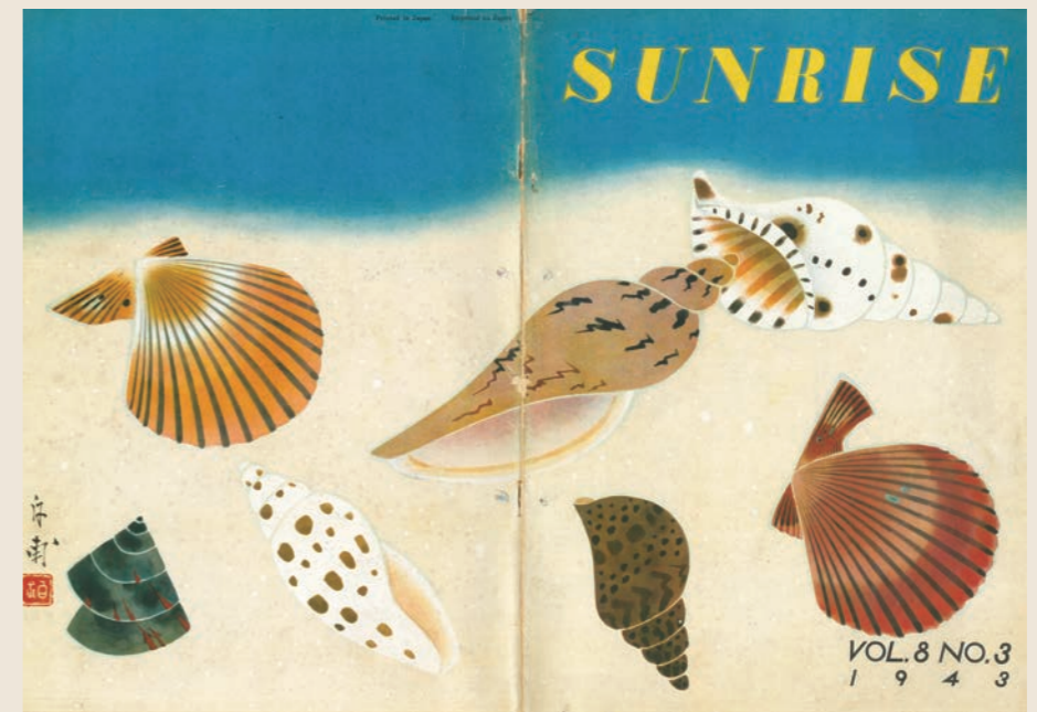
「旅(1926年8月)3巻8号」日本旅行文化協会／「旅(1931年8月)8巻8号」日本旅行協会 「Sunrise Vol.8 ,No.3」Board of Tourist Industry,1943