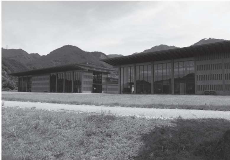
写真1 尾鷲市に二〇〇七年に設立した三重県立熊野古道センター。熊野古道に関する常設展や企画展を開催している。飲食・物販施設の「夢古道おわせ」が隣接している

消費を促すための施設として二〇〇七年（平成十九年）に熊野古道八鬼峠の麓に三重県立熊野古道センター（写真1）を二〇一二年（平成二十四年）に世界遺産構成資産の一つである「花の窟」に隣接して「お網茶屋」がオープンした。