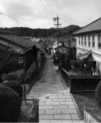
日本大正村のまちなみ 明智町