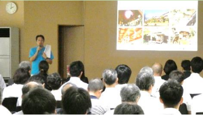
伊豆半島ジオガイドによるツアー